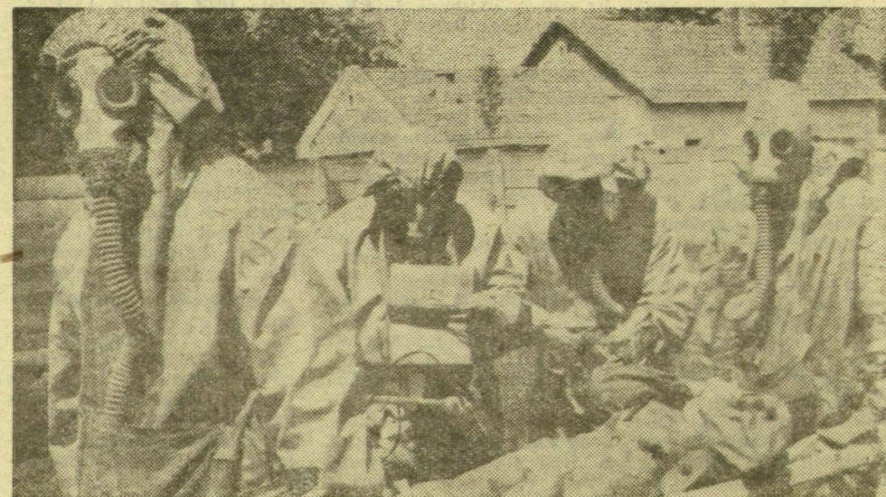
Jól képzett és felszerelt PV vegyvédelmi raj gyakorlat a Szenteseen