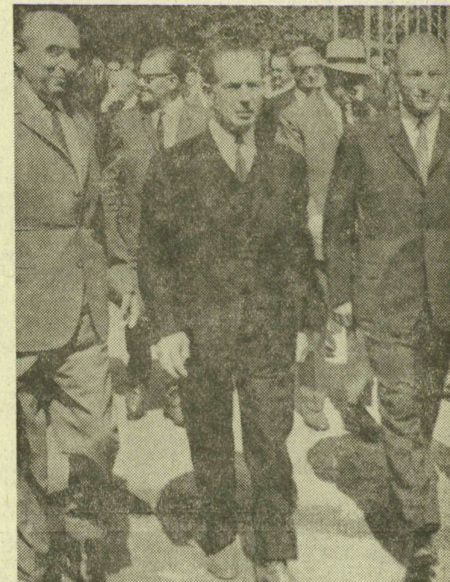
Fock Jenő miniszterelnök Bíró József külkereskedelmi miniszter társaságában a vásár megtekintésére indul

A BNV délután 2 órakor megnyitotta kapuit a nagyközönség előtt.