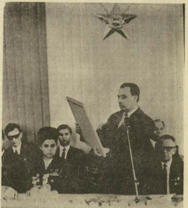
Dr. Korom Mihály átadja az MSZMP KB kongresszusi oklevelét a gyár igazgatójának

Magas kitüntetésekkel jutalmazták a Szegedi Konzervgyár dolgozóinak tavalyi eredményeit. A konzervgyári dolgozók immár tizenharmadszor érdemelték ki a Kiváló vállalat kitüntető címet, ezen belül negyedik alkalommal a Minisztertanács és a SZOT vörös vándorzászlóját, valamint a Szocialista munka vállalatát kitüntető címet. De ez alkalommal még nagyobb öröm és elismerés érte a szorgalmas kollektívát, mivel a pártunk X. kongresszusának tiszteletére indult munkaverseny-eredményeik alapján elnyerték az MSZMP Központi Bizottságának kongresszusi oklevelét. A magas kitüntetések átadására tegnap délután került sor a vállalat dolgozóinak ünnepi nagygyűlésén.