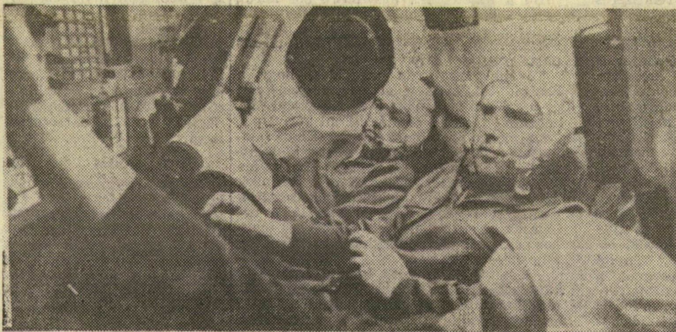
A SOJUZ-10 FEDELZETÉN. A három űrhajós a Szojuz-10 belsejében, balról jobbra: A. Jeliszejev, V. Satalov, Ny. Rukavisnyikov

méter, a levegő nedvességtartalma és összetétele normális. Az űrhajó valamilyen fedélzeti berendezése hibátlanul működik. Amikor az űrhajó a Szovjetunió te-