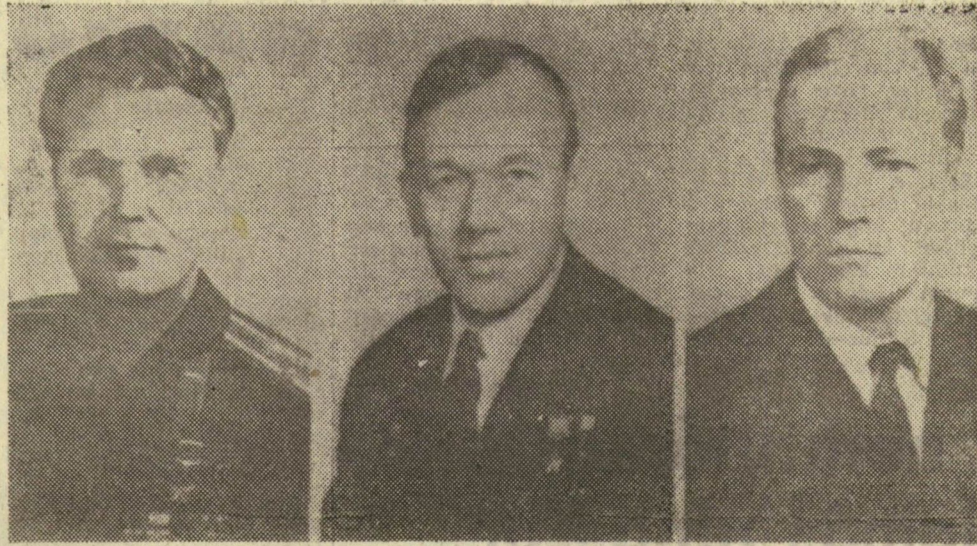
MEG A FÖLDÖN. A Szojuz-10 űrhajóssal — balról jobbra —: V. Satalov parancsnok, A. Jeliszejev űrhajós mérnök és Ny. Rukavisnyikov kutatómérnök

Az űrhajóban a belső hőmérséklet 21 Celsius-fok, a légnyomás 780 higanymilli-