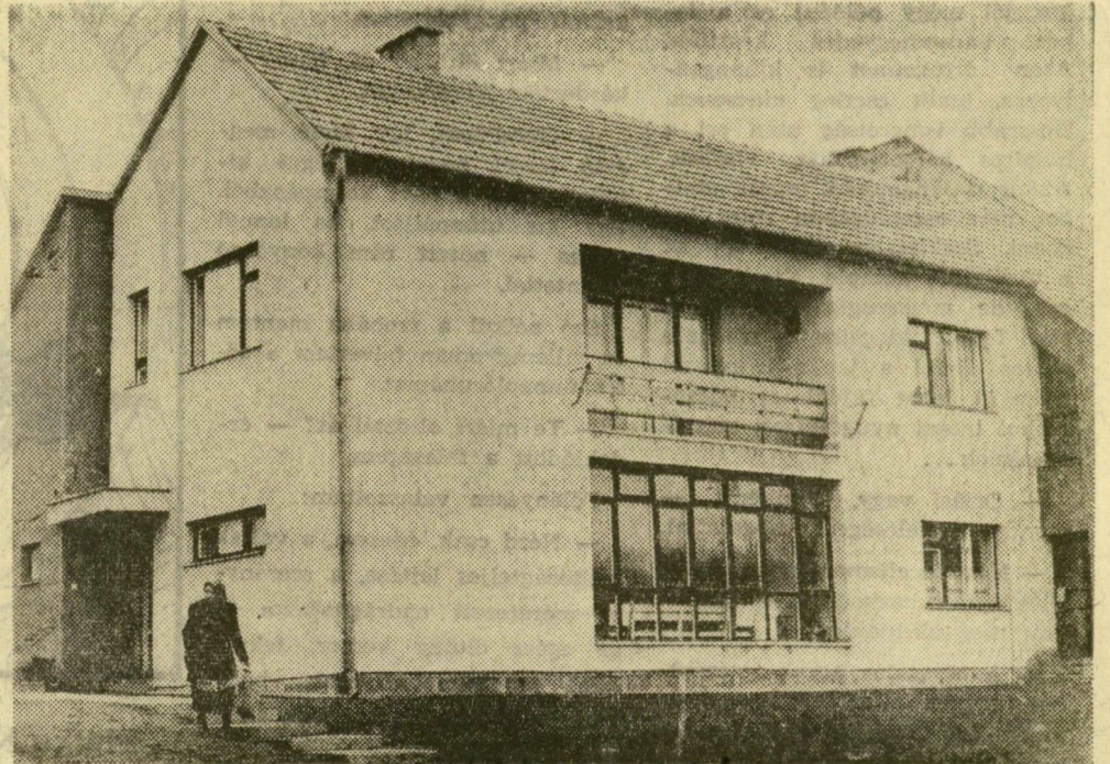
A szentesi új orvosi rendelő