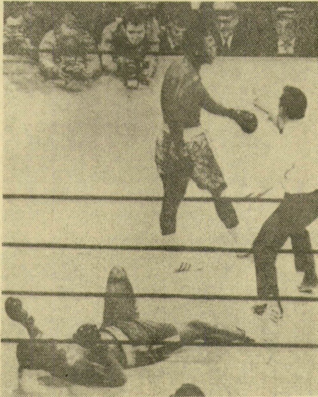
Joe Frazier a mérkőzés 15. menetében leütötte ellenfelét, aki a ringben a hátán fekszik

— Ilyen nehéz még soha nem voltam, s ilyen nehéz este még sohasem várta Frazier. Már eldöntöttem, melyik menetben végzek a fiúval, de előre nem árulom el. Miért vegyem el a nézők örömet, hogy izguljanak. Frazier ezt válaszolta: