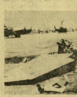
Tegnap reggel Phnom Penh repülőterén készült felvételünk, az egyik szétrombolt dél-vietnami repülőgépről

A fővárostól mintegy 13 kilométerre levő repülőteret a partizánok aknavetőkkel lőni kezdték és az egyik lövedék eltalálta a repülőter napalmbombarakárát, amely felrobbant. A robbanás jeladás volt a főváros elleni közvetlen akcióra. Phnom Penh keleti és északi részei kerültek aknavetők tüze alá. A becsapódó lövedékek és a repülőteren egymást követő robbanások szinte az egész fővárost megrázkódtatták.