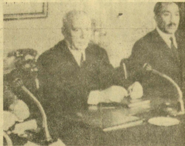
Képünkön: Podgornij (balról) megbeszélést folytatott Anvar Szadat egyiptomi elnökkel

Nyikolaj Podgornij, a Szovjetunió Legfelsőbb Tanácsa Elnökségének elnöke, aki az asszuáni gátrendszer felavatásával kapcsolatos ünnepségek alkalmából érkezett az EAK fővárosába, beszédet mondott azon a fogadáson, amelyet Anvar Szadat egyiptomi elnök adott a tiszteletére.