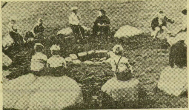
Kép egy svédországi játszótérről. Csak néhány szikla van körberakva. Hangulatos, remek ülő- és játszóhely a gyerekeknek. A középső kis körben még esti tábor-tűzet is lehet gyújtani.

tőségét, hogy különbözzünk. Hogy Tarján ne hasonlítson Miskolcra, Pécs új negyedeire, hogy az egyes tarján belsők ne egymást mintázzák sorra. Reméljük, egyszer erre is telti fog.