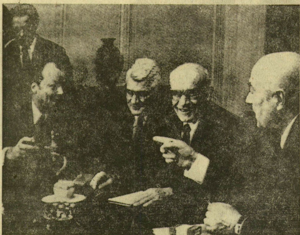
Wladyslaw Gomulka, a LEMP KB első titkára fogadta a Varsóban tartózkodó Willy Brandt nyugatnémet kancellárt. Képünkön: Gomulka és Cyrankiewicz miniszterelnök a párt KB hivatali helyiségében Brandt kancellárral

Varsóban, a lengyel minisztertanács épületében kedden délelőtt folytatódott Jósef Cyrankiewicz miniszterelnök és Willy Brandt kancellár hétfőn délelőtt megkezdett hivatalos tárgyalásai. A napirenden a kétoldalú kapcsolatok és az európai helyzet időszzerű kérdései szerepeltek. A tárgyalásokon különös figyelmet fordítottak a gazdasági együttműködés bővítésére és elmélyítésére, az ifjúsági szervezetek kapcsolatainak kiépítésére, a kulturális csere kibontakozására. Brandt kancellár elmondotta, hogy az európai problémák áttekintésénél egyebek között érintették Nyugat-Berlin ügyét.