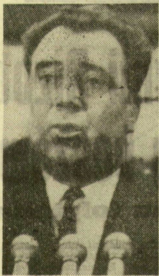
munka egyre erőteljesebben a visszaeső, veszélyes bűnözők tevékenységének korlá-

A közbiztonság fokozottabb védelméről szólva hangsúlyozta: a bűnüldözés