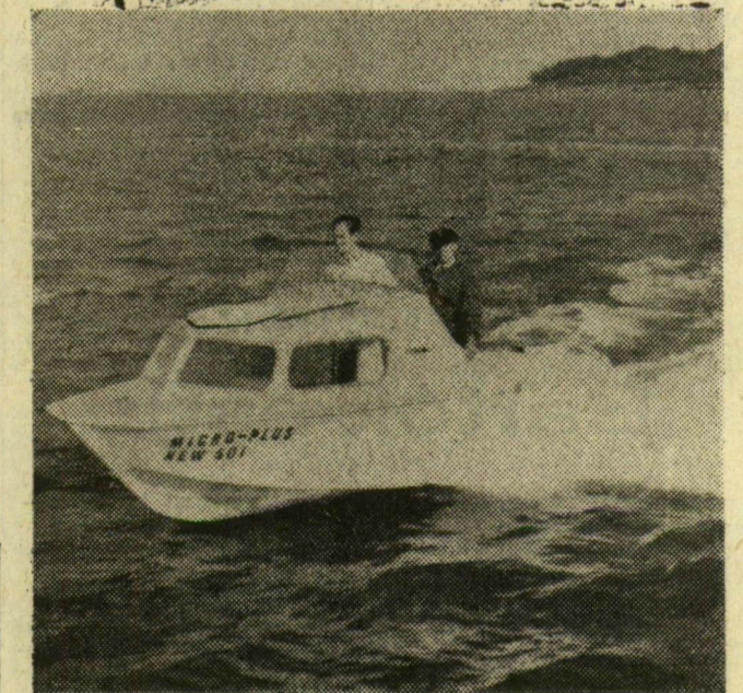
POLIÉSZTER MOTORCSÓNÁK. Bondonban új műanyag testű motorcsónakot mutattak be, amely akkor sem süllyed le, ha szintúg megélik vízzel. A csónaktest ugyanis kettős falú rekeszekből tevődik össze, amelyet könnyű, s rendkívül előnyös „cellobond” poliészterből gyártottak.

VÍZSZINTES CSAPADEK. A földnek oly szükséges nedvességet a ciklonok által hajtott felhőkből kapjuk. De van a csapadékoknak egy másik fajtája is, amelyek a ködből rakódnak le, azokon a tárgyakon, amelyek a széláramra merőlegesen helyezkednek el. Ez az úgynevezett vízszintes csapadék: dér, jégkéreg. Mennyiségét jóval nehezebb mérni, mint a havat vagy az esőt. Nagyon fontos szerepe lehet azonban, különösen a hegyvidékeken, ahol néha a légköri csapadék összmenyiségének egyharmadát teszi ki. A tudósok megállapították, hogy a jégképződés idején a fémhuzalok minden méterét nem egyszer több mint két kiló súlyú jég terheli. Egyetlen tél alatt a mindössze két és fél méter magas fenyőn körülbelül hatvan kiló zúzmararakódik le. Ha ezt a számot átlagosnak vesszük, és kiterjesztjük egy hektár területen levő fenyőcsemetérre, akkor a tél folyamán a zúzmarából származó csapadékkiegészítés hatszáz tonnára rúg. A bukkerdében a csapadékévi mennyisége kétszáz milliméterrel — tehát húsz százalékkal — emelkedik.