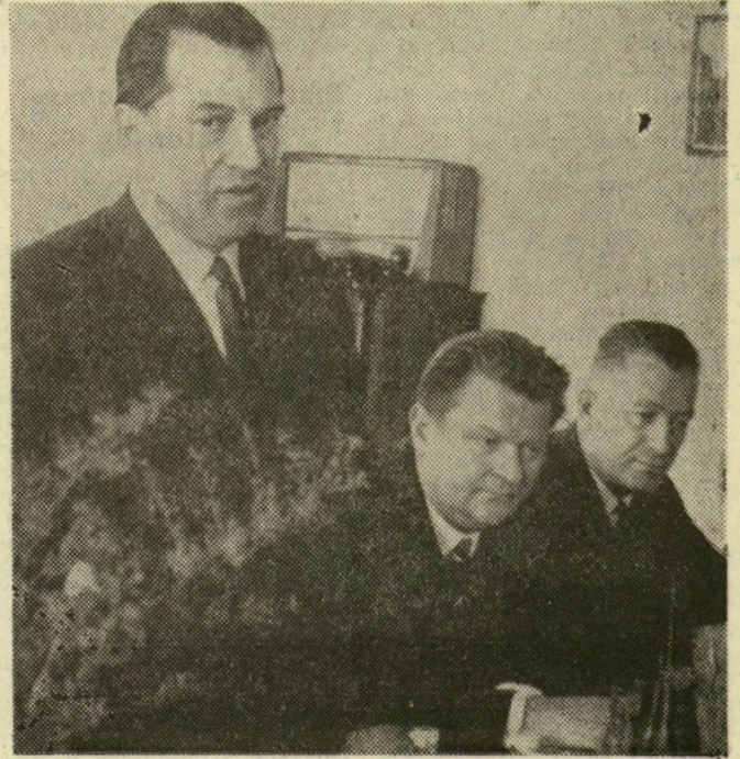
A román delegáció a megérkezés utáni fogadáson

A küldöttség három napot tölt a megyében. Tegnap a megérkezés után a Hazafias Népront megyei bizottsága adott fogadást Tábor utcai titkárságán a vendégek tiszteletére, majd délután megnézték a szegedi szalámgyárat. Ma délelőtt a népront Szeged városi bizottságára látogatnak, részt vesznek egy közös megbeszélésen, amelynek témája, hogy milyen tevékenységet végez a népront az értelmiség körében. Delután a delegáció a szentesi Árpád termelőszövetkezetet tekinti meg, baráti találkozón is-