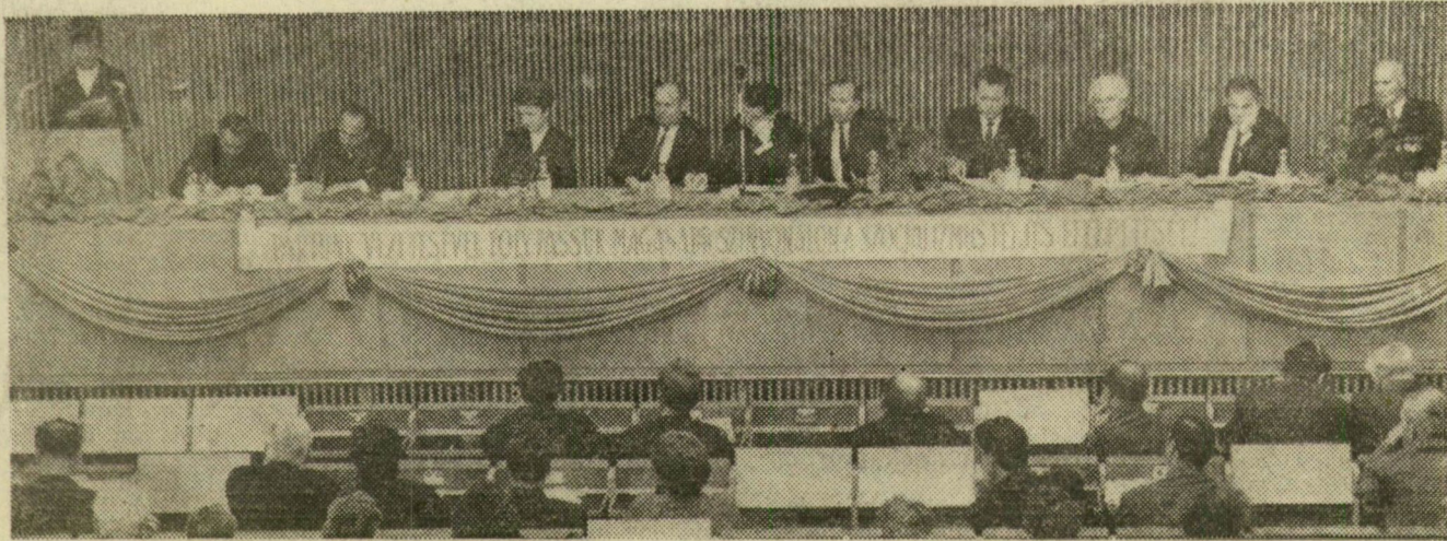
A Szeged városi pártértekezlet elnöksége

Beszámoló Szeged négyéves fejlődéséről — Élénk vita a gazdasági és társadalmi élet kérdéseiről — Megválasztották a Szeged városi pártbizottságot