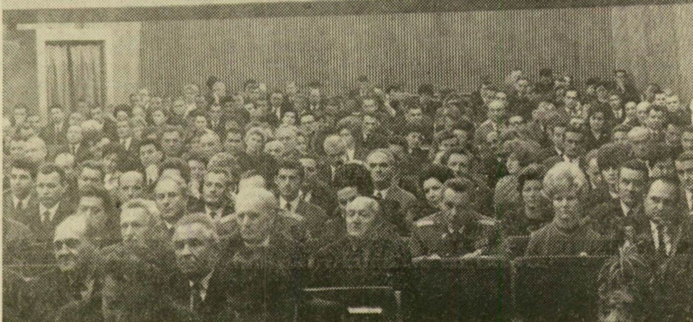
A pártértekezlet résztvevőinek egy csoportja