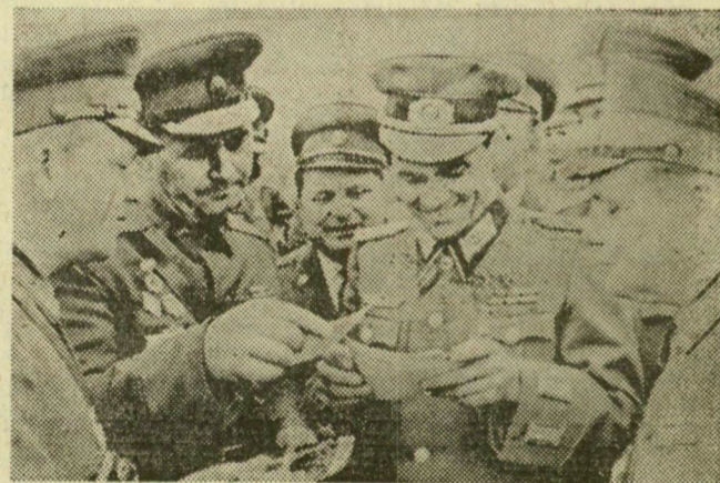
Katonatisztek egy csoportja megtekintti az első fotókat a Varsói Szerződés hat tagállamának NDK-ban rendezett „Fegyverbarátság” fedőnevű hadgyakorlatáról.