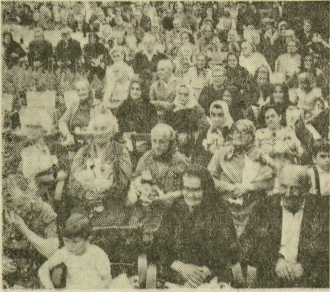
A szociális otthon parkjában sok százan figyelik a műsort