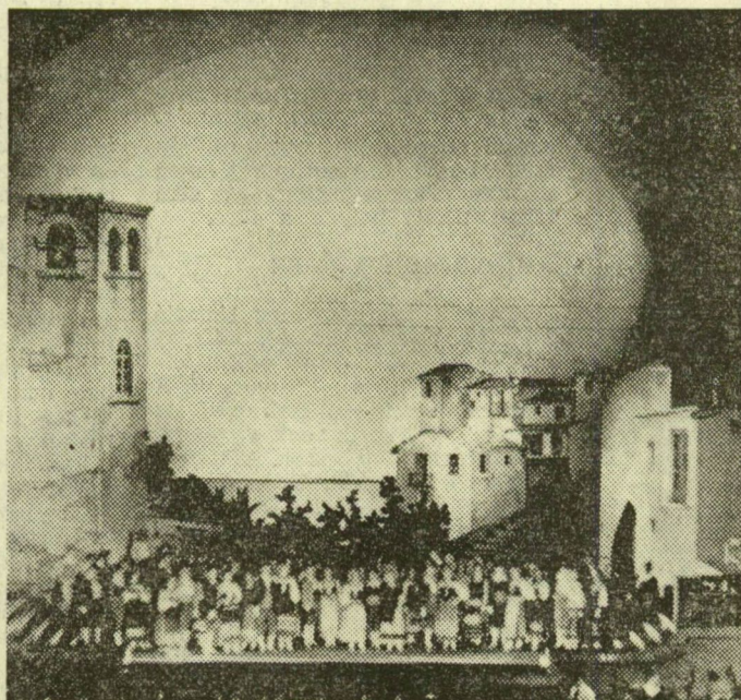
Pietro Mascagni 1935-ben a Parasztbecsület délelőtti próbáján, a szegedi színházban vezényli az Állami Hangversenyzenekart. (Első képünk.) — Színpadkép a Parasztbecsület 1935-ös előadásáról. Diszlettervező az operaház főrendezője,