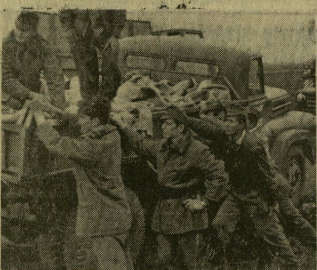
Magyar és szovjet katonák is védik a gátakat: homokzsákokkal indul az autó

tékben, hogy az közvetlenül fenyegetné egyes községek lakosságát. Eppen ezért tegnap