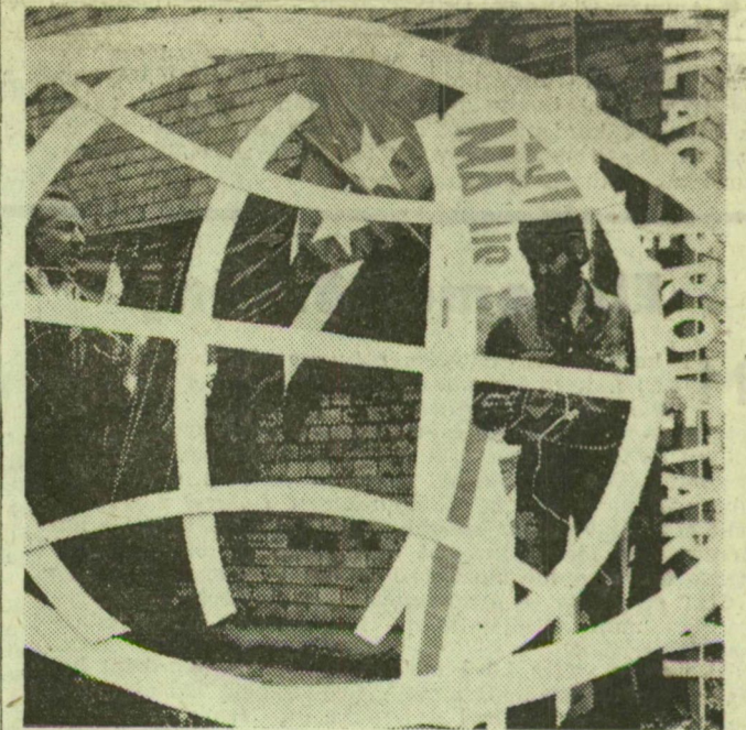
A 10-es AKÖV Bakay Nándor utcai telepén készül az autóbussz-pályaudvarra kerülő transzparens

Éljen és virágozzék szeretett hazánk, a Magyar Népköztársaság!