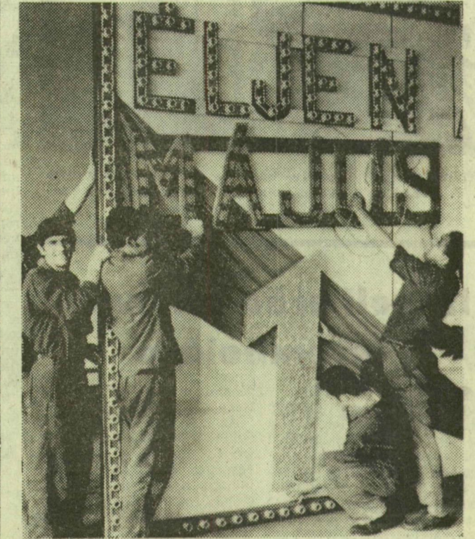
A kábelgyár homlokzatára kerül az ünnepet élítő hatalmas tábla

A KISZ Központi Bizottsága — érdemei elismerése mellett — Méhes Lajos első titkár tisztségé alól felmen-