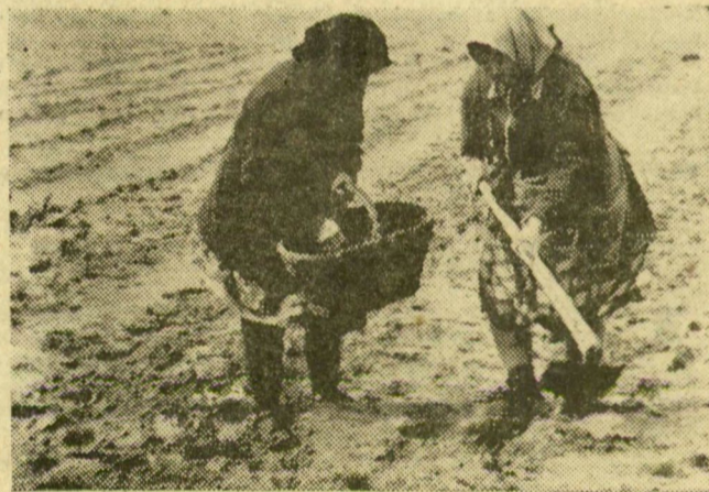
A homokos részen ültetik a burgonyát

ladni a munkákkal. Eddig 75 holdon vetettek borsót, szakaszosan. Összesen 125 holdat terveztek. Néhány holdon földbe került a burgonya is. De a többi munkával jó időre várnak. Már most számolnak a kiesésekkel, a „megdrágult” üzemi költségekkel. Az üvegházban szedésre érett a zöldségek, a pár nap múlva piacra küldik, mellette karalábét és salátát is.