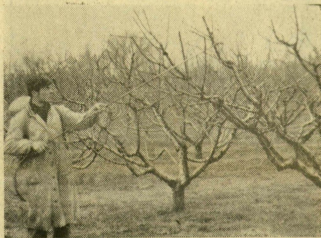
A domaszéki ifj. Imre István permetez