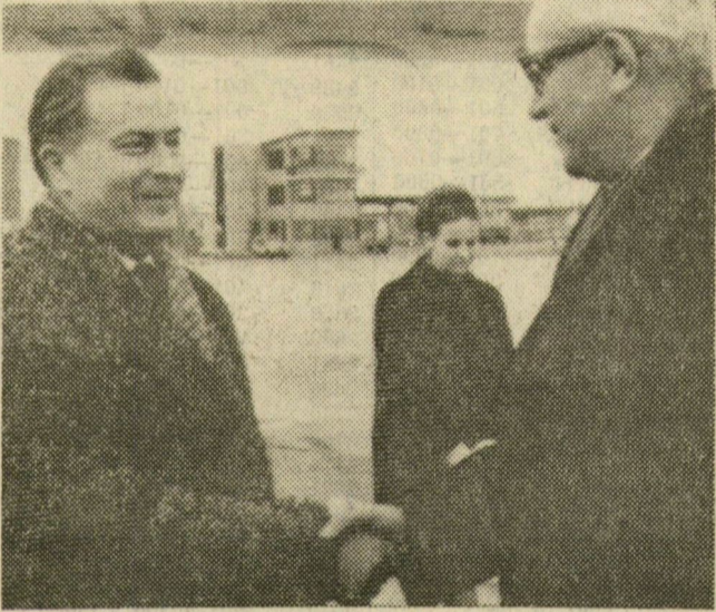
A magyar külügyminiszter (jobb oldalt) utazás előtt a Ferihegyi repülőtéren

A repülőtérrel Péter János és kísérete varsói szálláshelyére, a Myslewickipalotába hajtatott.