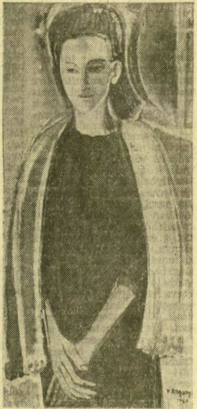
V. Bazsonyi István LÁNY

tak fejenként három-háromszáz forint jutalmat. A Jó-brigád persze négy-négy száz forintot kapott, mivel ők ezúttal már jelvényt szereztek, nem pedig oklevelet.