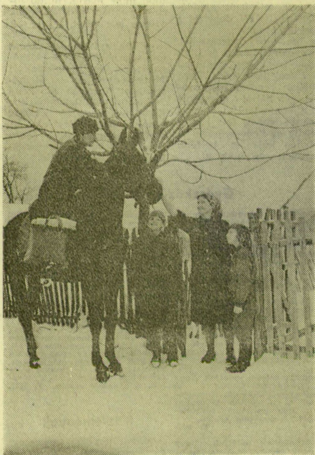
POSTAKEZBESÍTÉS LÓVAL. A havas téli időszakokban a járhatatlan utak a postások munkáját is nagymértékben megnehezítik. A Cegléd melletti Csemő község postásai lovas kordélyon, illetve lóháton járják a tanyavilágot