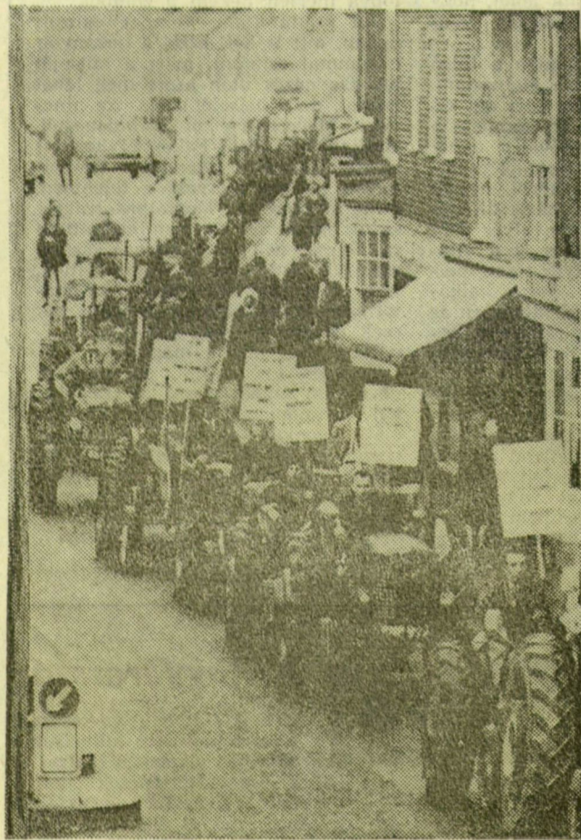
TILTAKOZÓ FELVONULÁS. Száz traktorral vonultak fel Londonban az angol farmerek, hogy — parlamenti képviselőjükkkel az élen — tiltakozzanak a kiszolgáltatottságukat növelő új mezőgazdasági törvények ellen