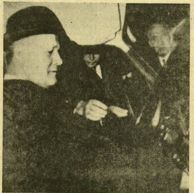
Losonczi Pál megtekintette az Iran National nevű gépkocsizütemet. Képünkön: Losonczi Pál a „Pelikán” személygépkocsi volánjánál

Losonczi Pál és kísérete pénteken, a kora délelőtti órákban indul vissza Budapestre.