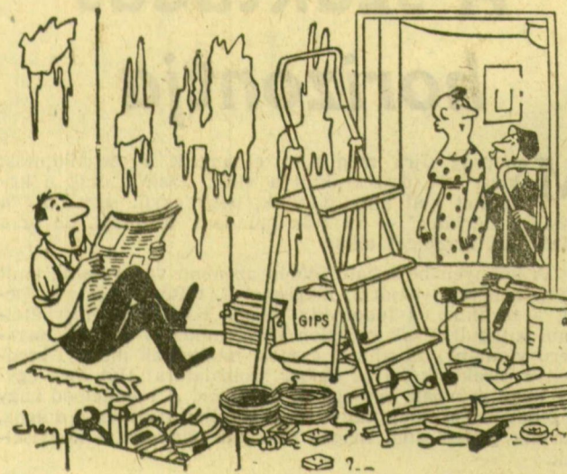
A Weltwoche karikatúrája

— Mihelyt Albert elkészül a szoba festésével, hozzánk költözik a mama.