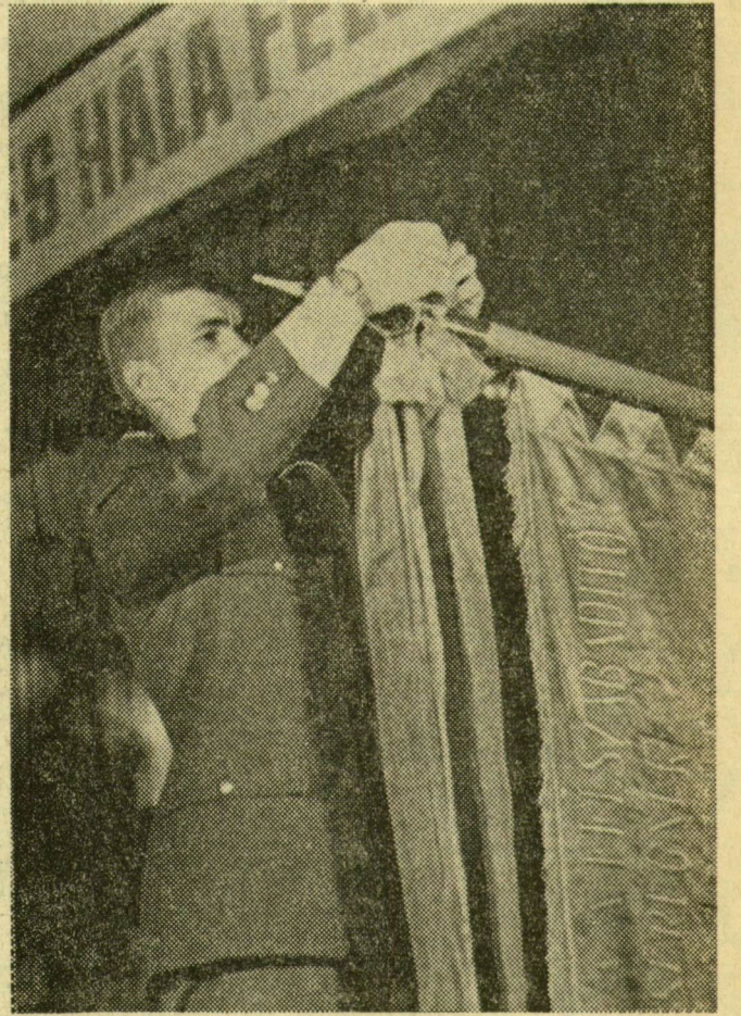
Fölkötik a szalagokat az emlékszólóra