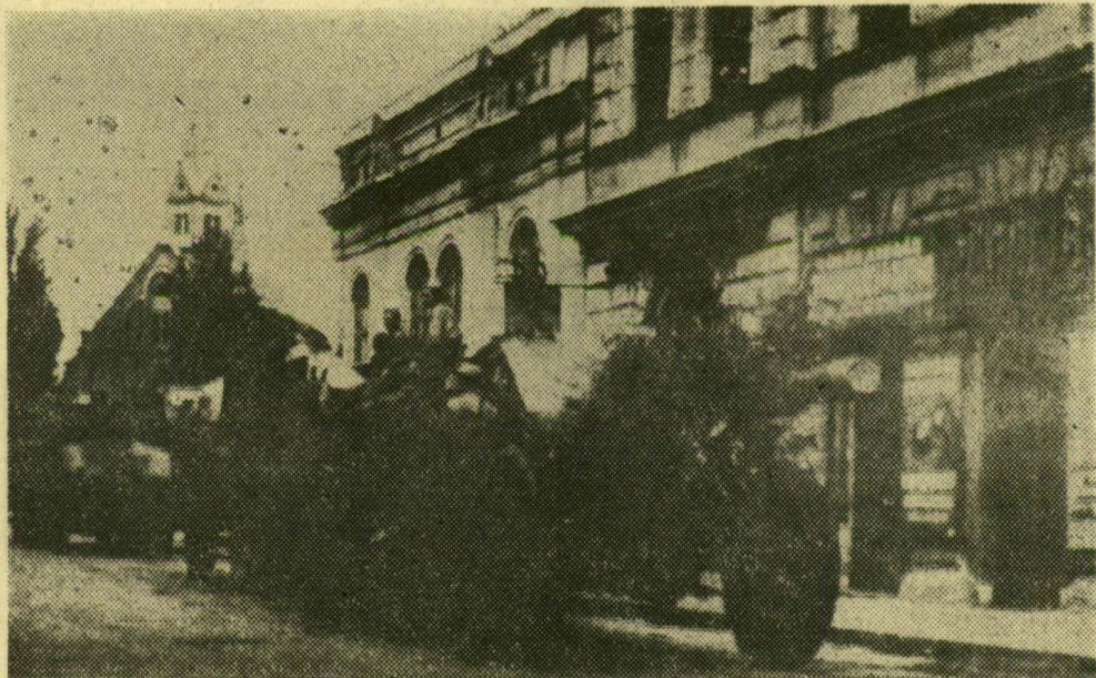
A nehéztüzérség a mai Lenin körúton jött, itt csatlakozott a csapatokhoz