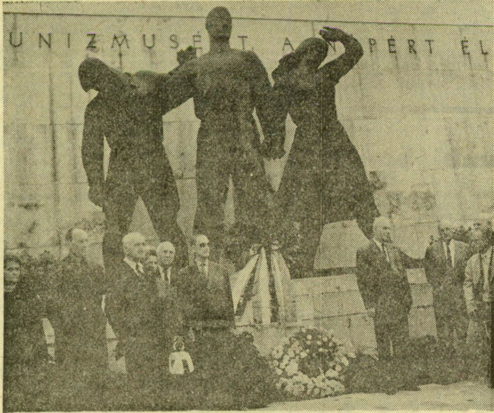
PÁRIS FELSZABADULÁSÁNAK EMLÉKÉRE, A Franciaországi Volt Önkéntesek és Ellenállók Egyesületének magyar származású tagjai budapesti látogatásuk alkalmából, Párizs felszabadulásának 25. évfordulójára emlékezve, a Hősök tereén megkoszorúzták a Magyar Hősök emlékművét. Ezt követően a Kerepesi temetőben, a munkásmozgalom nagy halottainak emlékművénél helyezték el koszorút. A képen: Koszorúzás a Kerepesi-temetőben

A felmérések szerint tetőzettel ellátott, de oldalról többnyire nyitott színekben hozzávetőleg egymillió tonna gabonát helyeztek el. A termést ponyvával és a nyitott épületrészeknél zsákokkal védik az időjárás viszontagságai ellen. Szabadban mintegy 400 ezer tonnányi búzát tárolnak; az értékes gabonát ezeken a helyeken ponyvával, fóliával fedték le és rendszeresen ellenőrzik, hogy szárazon maradjon-e az áru. Erre különösen most, az esősebb napokon van szükség, amikor is eldől, hogy a raktárakból kirekelt termés összegyűjtésénél kellő gondot jártak-e el.