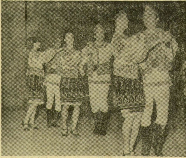
A bolgár együttes páros-tánca

A fesztivál résztvevői — utolsóelőtti programként — tegnap, szombaton este fogadásra vettek részt a Szakszervezetek Csongrád megyei Tanácsának új székházában,