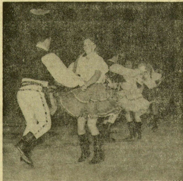
A szlovák csoport magyar csárdást jár