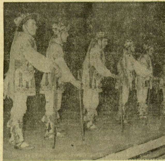
A román legények botos tánca

majd a közös vacsora után — legutolsó programként — a számukra rendezett bálon ünnepelték meg a találkozó sikerét. Ezen, a vasutas művelődési otthonban megtartott táncmulatságon adták át a legjobb női táncosnak járó „aranypapucs” és a legjobb férfitanácsosnak járó „aranyfokos” díjat.