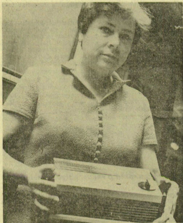
FŰT VAGY HŰT. A VBKM Transzelektro Gyára készítette el a képünkön látható, táskarádió nagyságú készüléket, amely nyáron ventilátorával hűt, télen pedig a fűtőszálak bekapcsolásával fűt. A készülék így télen és nyáron egyaránt használható