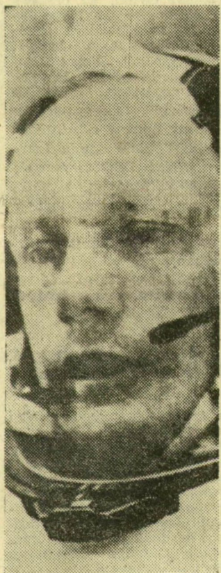
Armstrong, aki először lépett a Holdra.

„A Nyugalom Tamaszpont jelenti: a Sas leszállt” — ezzel a mondattal jelentkezett Neil Armstrong a Hold felszínéről, először az űrhajózás rövid történetében, 1969. július 20-án, magyarországi időszámítás szerint este 21 óra 17 perc 40 másodperckor. Embert szállító jármű, az Apollo-11 holdkompja, rádióhívójele szerint a „Sas” fedélzetén két űrhajóssal, Neil Armstronggal és Edwin Aldrinnal ekkor szállt le először idegen égitestre.