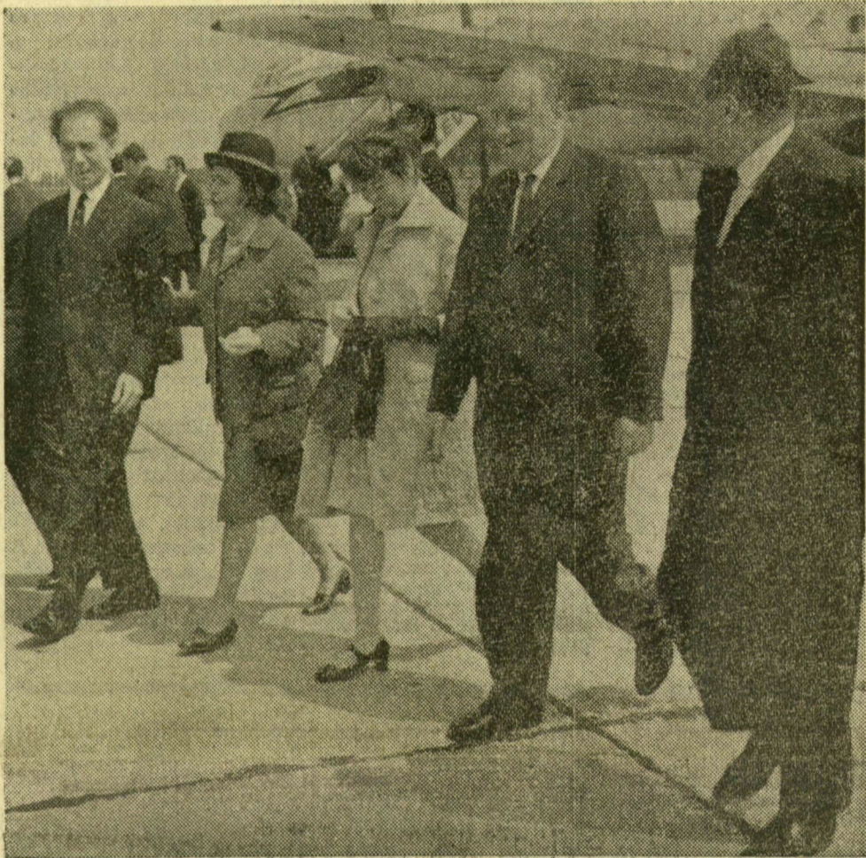
Küldöttségünk érkezése a Ferihegyi repülőtérre

Pénteken a kora délelőtti órákban a szófiai repülőtéren a bolgár párt, állami és társadalmi élet vezetői, élükön Todor Zsivkovval, a diplomáciai képviselők vezetői és munkatársai, a szófiai dolgozók képviselői búcsúztatták a Kádár János vezette magyar párt- és kormányküldöttséget. A magyar és a bolgár himnusz elhangzása után Todor Zsivkov és Kádár János mondott rövid búcsúbeszédet. A magyar delegáció tagjai, miután búcsúvettek a bolgár vezetőkől, beszálltak az IL-18-as repü-