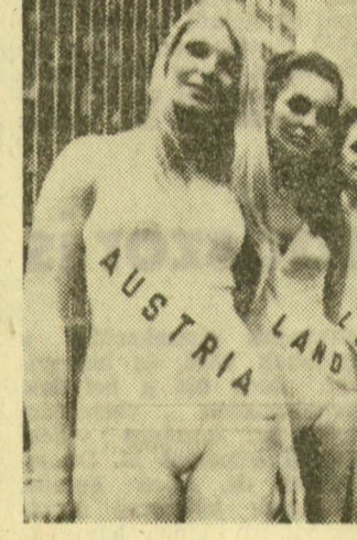
SZEPEK SZEPEI. New Yorkban most választják meg — mint már jelentettük — a „világszépét”. A képen: a versenyzők egy csoportja

A Sportfogadási és Lottó Igazgatóság tájékoztatása szerint a Mezőkövesden megtartott 27. heti lottósorsoláson a következő számokat húzták ki 16, 35, 57, 70, 74.