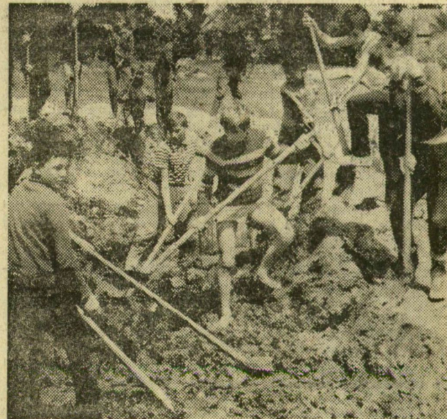
A Víz- és Csatornamű Vállalat Fonógyári úti építkezésén fiúk dolgoznak. A leendő vízmű alapjainak körvonalát bontakozik ki kezük munkája nyomán