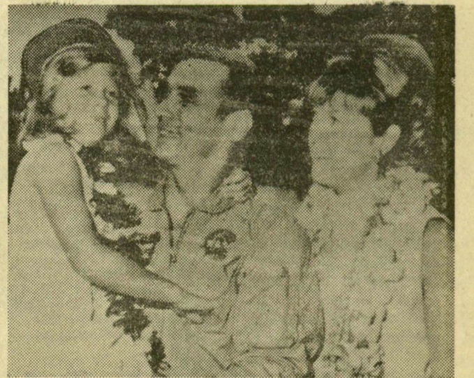
ÜRHAJÓS CSALÁDJA KÖRÉBEN. Eugen Cernant, az Apollo-10 hazatért űrhajósát felesége és kislánya üdvözi

akár többször is ki kell javítani. Az új felbontójának kötelessége gondoskodni a munkaterület elzárásáról, a közúti jelzések kihelyezéséről és esetleg megvilágításáról is. Lakott területen zajjal járó bontást este 9 és reggel 7 óra között tilos végezni. A rendelet szabálysértés-ként fogja fel, ha valaki hatósági engedély nélkül bont fel közutat vagy nem tartja be a helyreállításra vonatkozó szabályokat, határozatokat. Arról is intézkedik, hogy ha a munkát nem vagy csak rosszul végzik el, akkor az ütügyi hatóság a mulasztást elkövető cég költségére gondoskodik az út, járda vagy park helyreállításáról. Az új rendeletet a tanács végrehajtó bizottsága felterjeszti az Elnöki Tanácshoz, s majd kihirdetése napján lép életbe. A végrehajtásával kapcsolatos rendelkezéseket a tanács vb építési és közlekedési osztálya adja ki. Fehér Kálmán