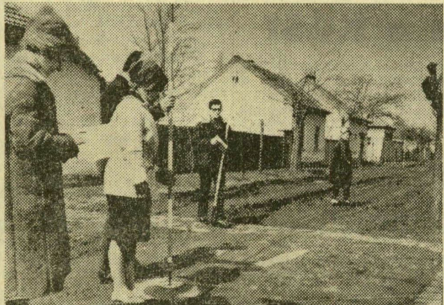
A szegedi Bártfai utcában az úttest méreteit határozza meg a geodétacsoport