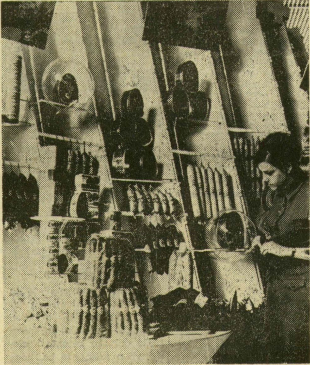
Tervezik az élelmiszeripari pavilont, a látogató majd így látja a sokféle inycenséget

A Budapesti Nemzetközi Vásár területén ismét megjelentek az asztalosok, szerelők, grafikusok, hogy felkészítsék a pavilonokat a 69-es ipari seregszemlére. A látványos külső készülődés mellett az ország valamennyi gyárában, üzemében a tervezők, a szakemberek most határozatképen, hogy milyen termékeket küldjenek a bemutatóra a hírnévért, a vévőkért folyó versenyre.