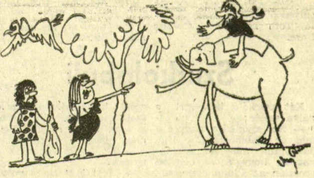
— Ot választom, neki „kocsija” van!

Csongrád megyei Vegyesiparcsikk Kiskereskedelmi Vállalat