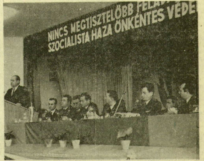
Komócsin Zoltán, az MSZMP Politikai Bizottságának tagja, a KB titkára beszédét mondja a munkásörök ünnepi gyűlésén

Vasárnap a szegedi Gera Sándor munkásörök egységet kintuntették A megyei parancsnokság legjobb önálló egysége címmel és az ezzel járó vándorserleggel. A munkásörök ünnepi gyűléséről Vándorserleget nyert a Gera Sándor munkásörök egység címmel lapunk 3. oldalán számolunk be.