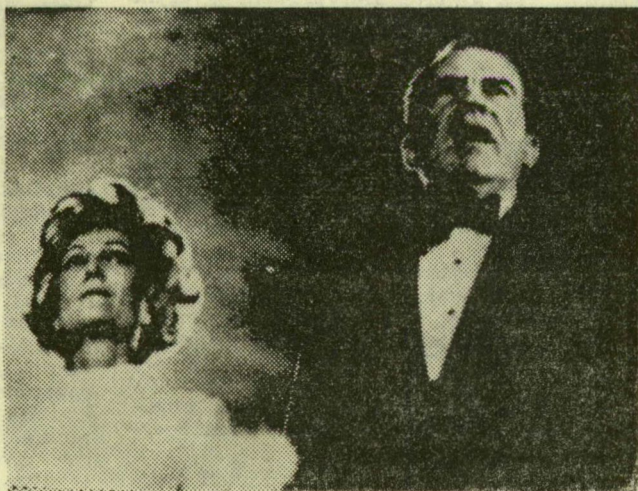
A beiktatás előestéjén nagyszabású hangversenyt rendeztek Washingtonban a megválasztott elnök tiszteletére. Képünkön Richard Nixon, a hangverseny elnöki páholyában, feleségével a nemzeti himnusz énekl.

Nyikolaj Podgornij, a Szovjetunió Legfelső Tanácsa Elnökségének elnöke és Alekszej Koszigin, a Szovjetunió Minisztertanácsának elnöke táviratban üdvözölte Nixont, az Egyesült Államok hétfőn beiktatott elnökét.