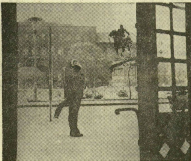
Minden fehér az Aradi vértanúk terén