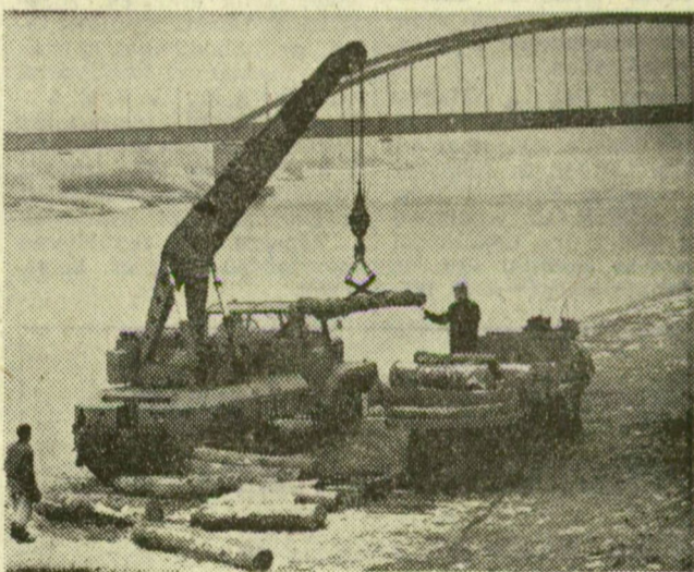
Rönkszállítás a Tisza-parton