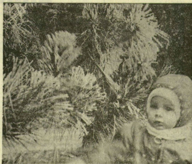
Zúzmara csillog a park fenyőin