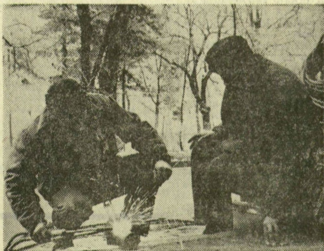
„Csillagszóró” a Magyar Tanácsköztársaság útján