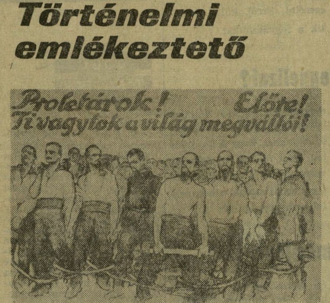
Plakát a polgári demokratikus forradalom győzelme utáni időből

1918. december 13.: Felvállalják a kommunista agrárprogramját.