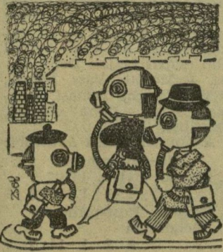
Ajánlatos utcai viselet

— Ápoltak lázadása. Egy anconai ideggyógyintézetben az idős ápoltak fellázadtak, mivel napokon keresztül piszkos edényben kaptak ételt és az orvosi vizitek szüneteltek. A lázadók több kórteremnek és a konyhának a berendezését szétzúzták. Mintegy száz rendőrnek sikerült csak a lázadókat megfékezni, akik közül többen azt kiabálták a rendőrök felé: „Azért nem vagyunk teljesen bolondok, hogy így bánjanak velünk”.