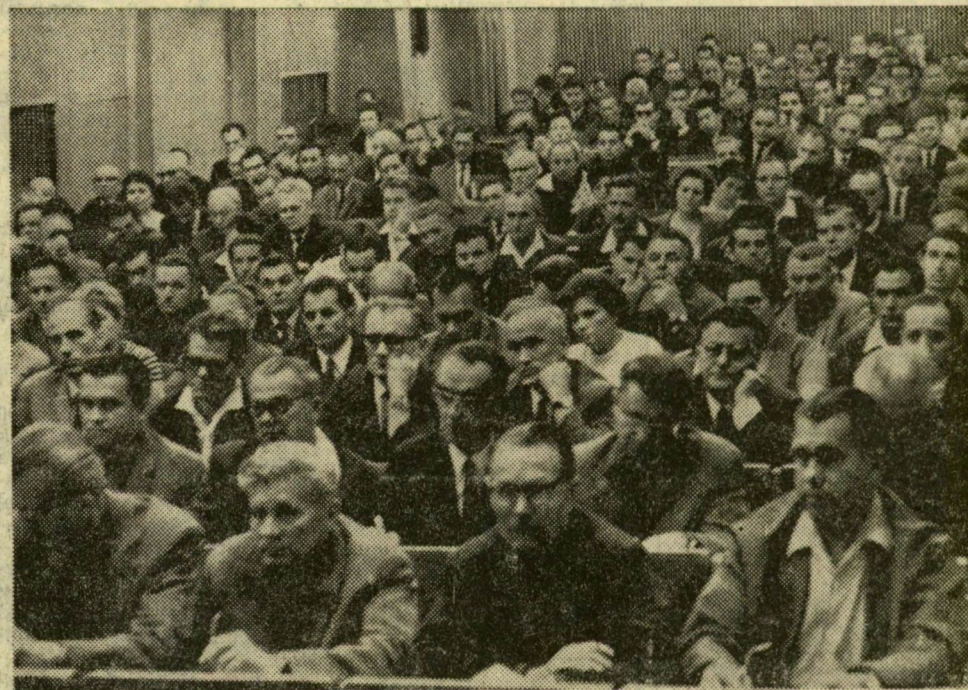
A pártaktívák résztvevőinek egy csoportja