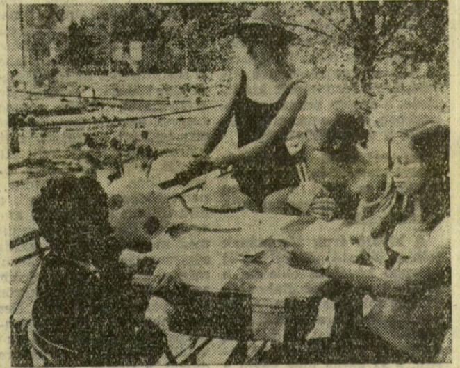
Az újszegedi partfürdőn sok üzemnek van már kabinháza, üdülője. Az áramszolgáltató dolgozóit itt kapta lencsére a riporter kártyázás közben