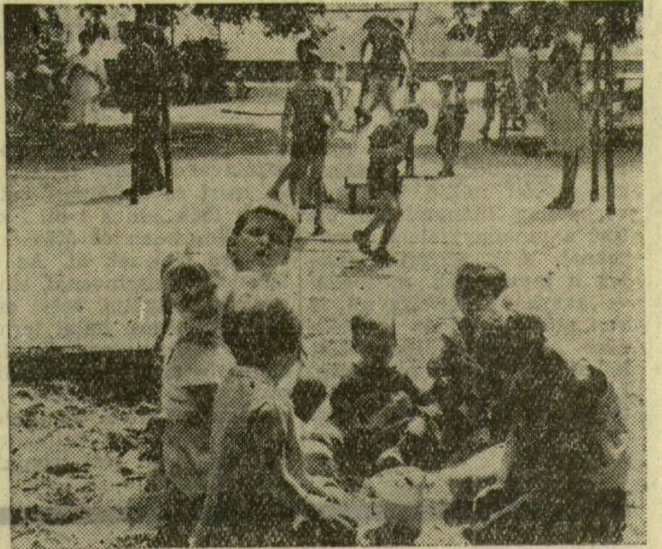
A Juhász Gyula utcai óvoda apróságai például a Tiszaparti sétányon találják meg nap mint nap a felüdítő játékokat

Nem is kell a Balatonra menni, sok parkjával, strandjával, üdülőjével Szeged is kitűnően alkalmas a kikapcsolódásra, pihenésre.