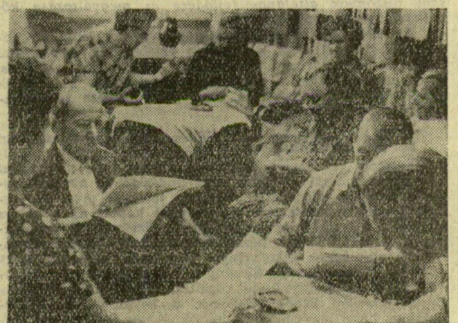
A nyugdíjasok művelődési házában olvasgatnak, kötögetnek a legidősebb szegediek. Somogyi Károlyné képriportja.