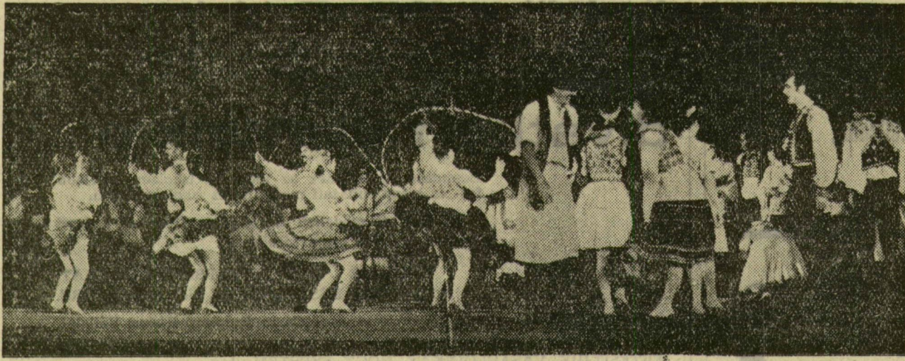
Mozgalmas jelenet a Megérett a szőlő című táncjátékból