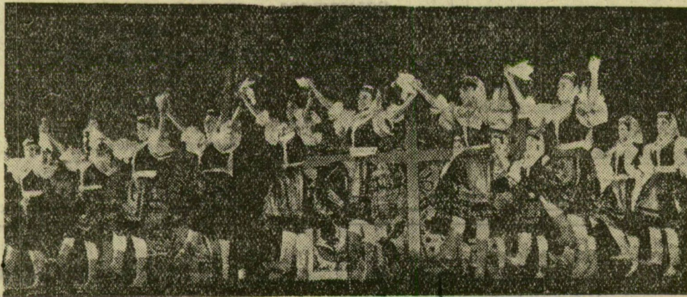
Szín pompás leánytánc

Képeink az Állami Népi Együttes műsorának főpróbáján a produkció legmozgalmasabb pillanatairól készültek.