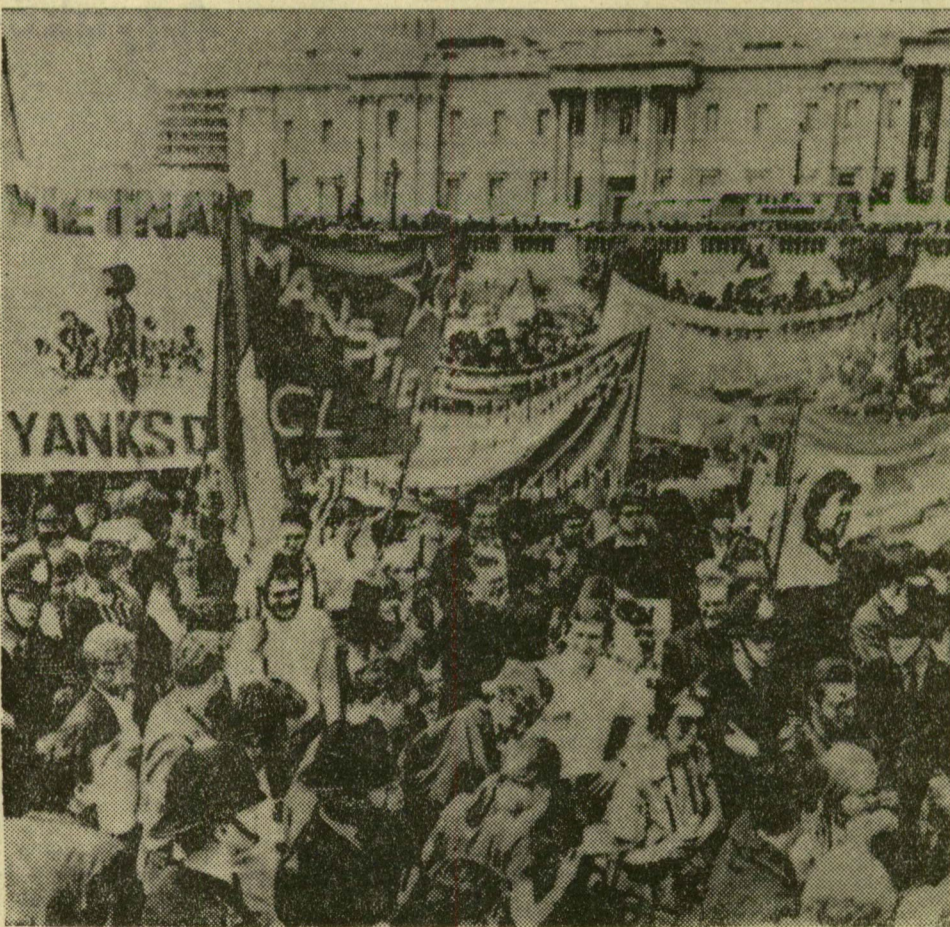
Rádiótelevízió — AP, CP

Stewart brit külügyminiszter szeptemberben Magyarországra, Romániába és Bulgáriába látogat. Az erről szól bejelentés az alsóházban hangzott el. Stewartnak ez lesz a második látogatása hivatalos minőségben Magyarországon: először 1964-ben járt Budapesten.