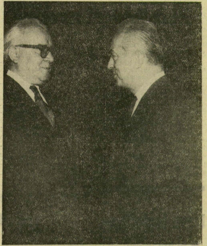
A magyar külügyminiszter Nesut Sumtay, a Török Köztársaság budapesti nagykövetségének ideiglenes ügyvivőjével beszélget elutazása előtt a Ferihegyi repülőtéren

A megnyitó ülésen Nasszer elnök mond beszédet. Az ülés során a kongresszus megválasztja az ASZU elnökét és a bizottságok tagjait.