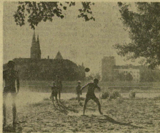
Jölesik labdázni a part homokján