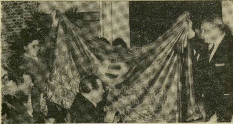
A zászlóadás ünnepélyes pillanata