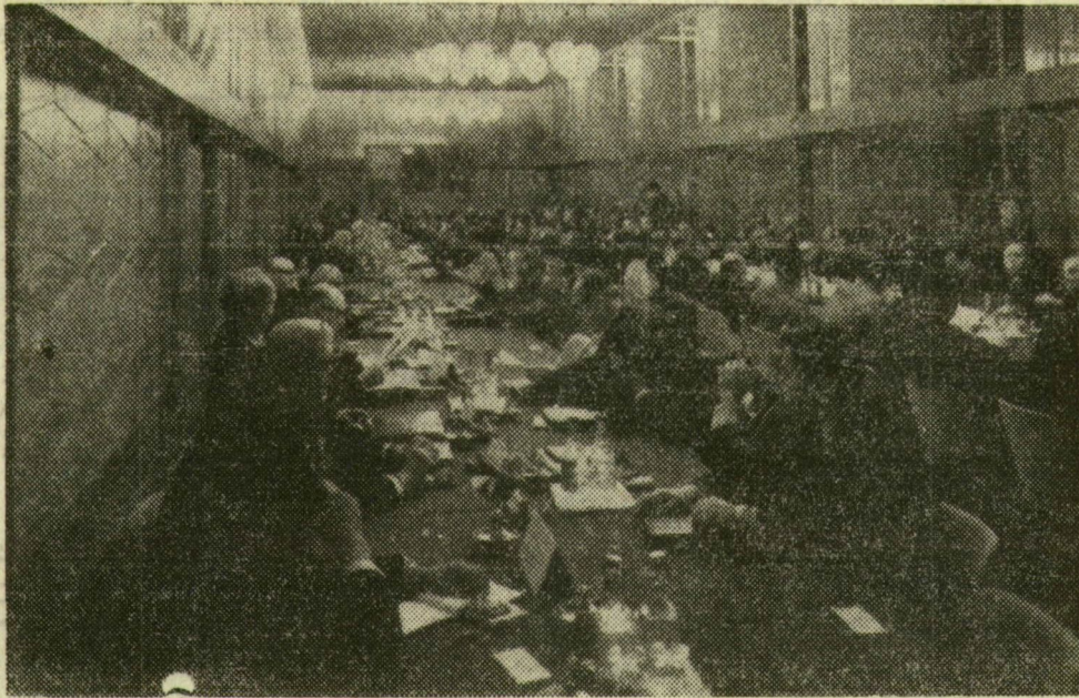
Budapesten tanácskoznak a kommunista és munkáspártok küldöttei. Képünkön: a konzultatív találkozó résztvevői

nyilatkozatában kijelentette: a Dél-afrikai Kommunista Párt kulcsfontosságú frontszakaszokon vívja harcát. A nemzetközi imperializmus